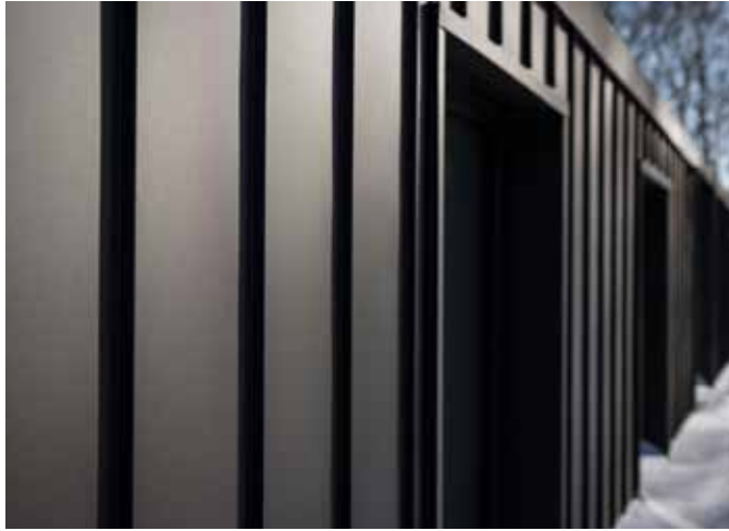
FOTON HOUSE IN THE MOUNTAINS: MACIEJ LULKO, POLEN. COPYRIGHT: SSAB