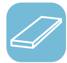
Blachy grube walcowane na gorąco

Połączenie odporności na warunki atmosferyczne oraz łatwej obróbki warsztatowej sprawia, że stale SSAB Weathering stanowią efektywny kosztowo wybór dla szerokiego zakresu zastosowań.