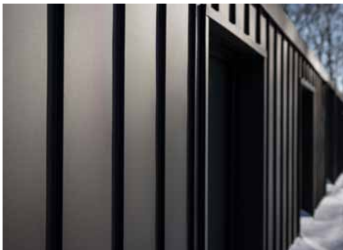
ZDJĘCIA HOUSE IN THE MOUNTAINS: MACIEJ LULKO, POLSKA COPYRIGHT: SSAB