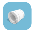
Bande laminée à froid