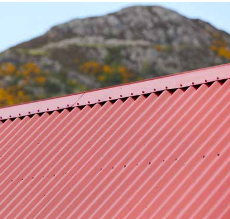
PHOTOS FERNAIG COTTAGE: AI REY SPACES, ARCHITECTURAL PHOTOGRAPHY; COPYRIGHT: SSAB

PROJET: WESTER ROSS, ÉCOSSE, ROYAUME-UNI »FERNAIG COTTAGE«