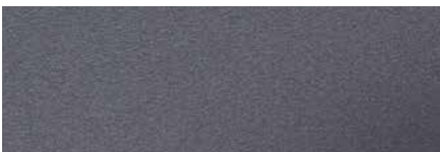
Metallic Dark Silver RR41/SS0044