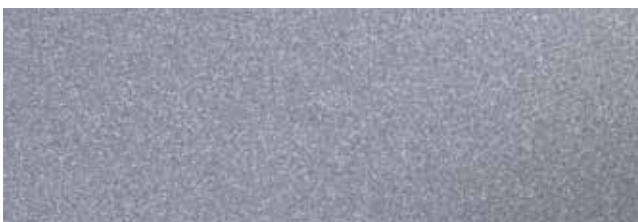
Metallic Silver RR40/SS0045