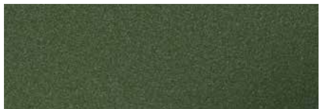
Leaf Green RR594/SS0874