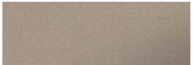
Metallic Gold RR42