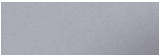
Metallic Sterling RR974/SS6045