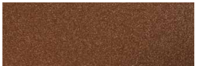
Metallic Copper RR979/SS0778