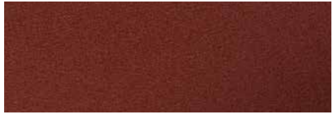
Cottage Red RR29/SS0758