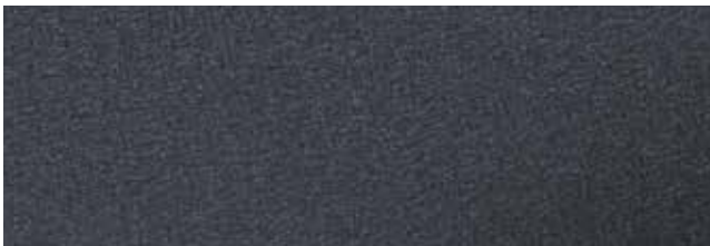
Anthracite Grey RR2H8/SS0087