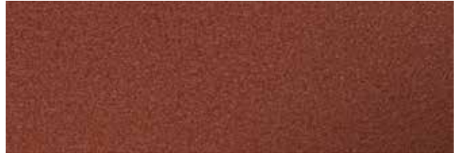
Tile Red RR750/SS0760