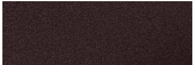
Chestnut Brown RR887/SS0435