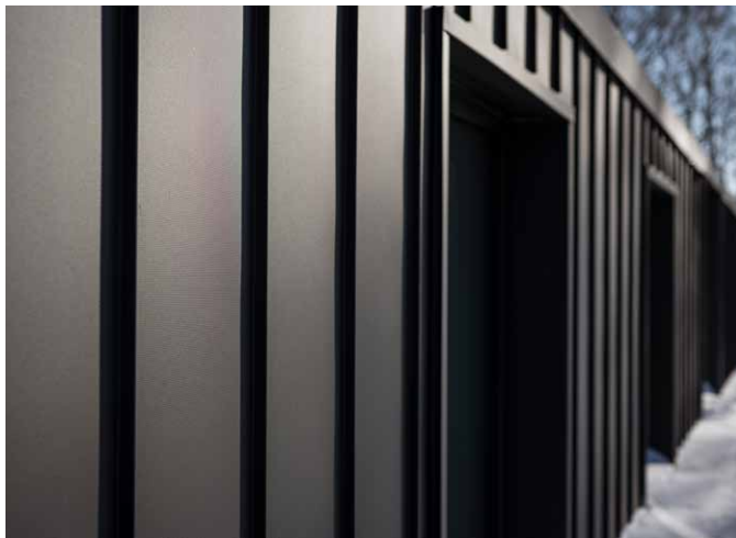
KUVAT KOHTEESTA "HOUSE IN THE MOUNTAINS": MACIEJ LULKO, PUOLA. COPYRIGHT: SSAB