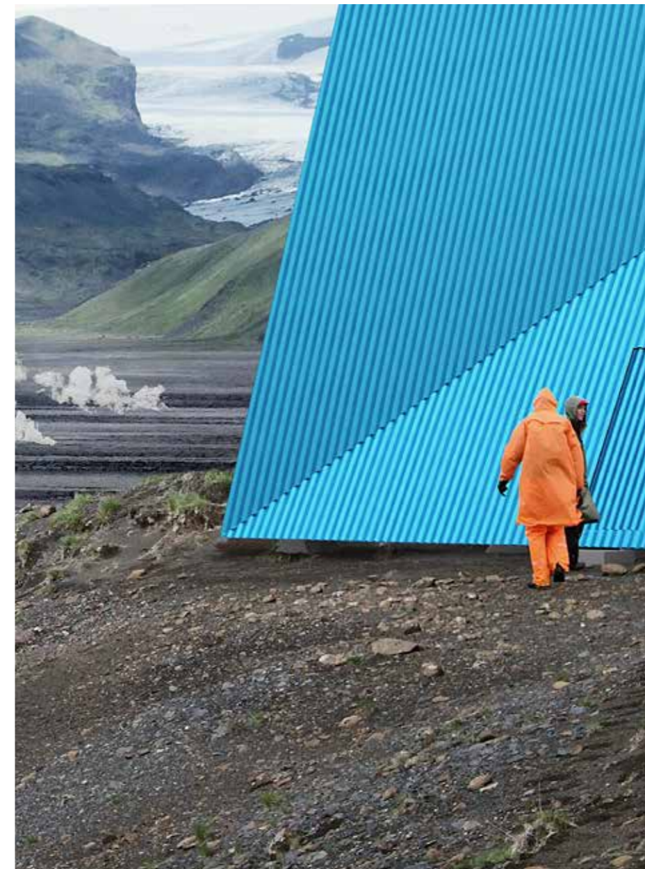
Kuvitus: Utopia Arkitekter