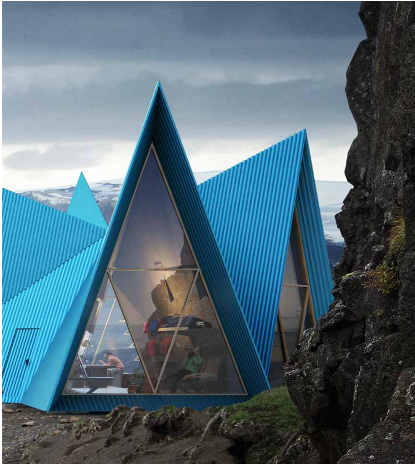
SKÝLI, ISLANTI ARKKITEHTI: UTOPIA ARKITEKTER TUOTE: GREENCOAT PURAL BT VÄRI: SKÝLI BLUE, RR4J8 / SS0501

Skýli on ehdotuksena luotu tunturimaja, jonka ytimessä on kestävä kehitys. Sen kirkkaansininen katto, joka on suunniteltu tehtäväksi GreenCoat®-maalipinnoitetusta teräksestä, on suunniteltu heijastamaan pohjoista valoa. Omaleimaisella muodollaan maja luo kontrastin vuoristomaisemaan – erottuen, mutta sitä häiritsemättä.