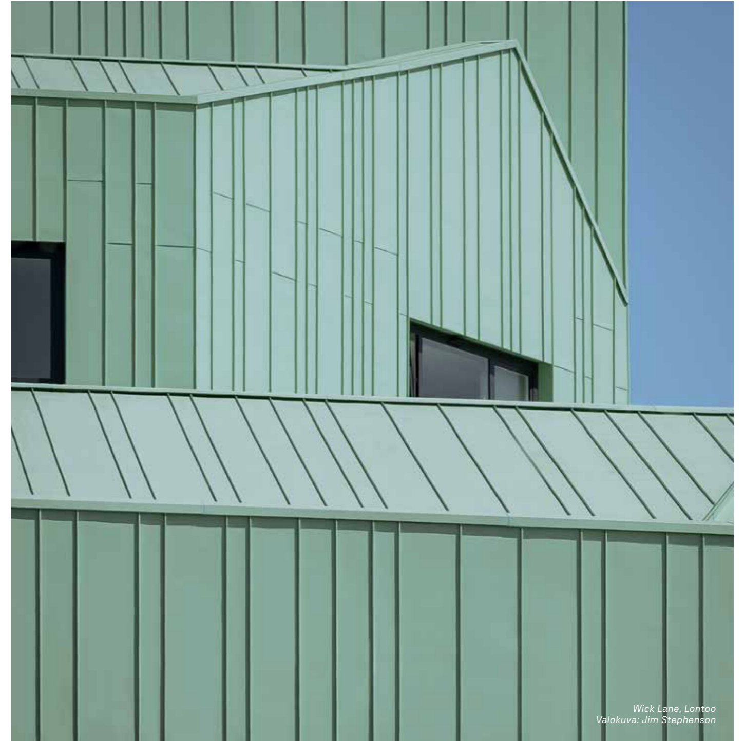
Wick Lane, Lontoo