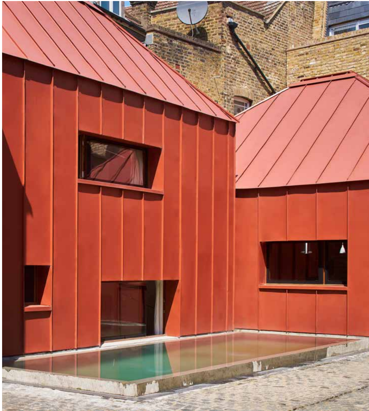
TIN HOUSE, LONTOO, ENGLANTI ARKKITEHTI: HENNING STUMMEL ARCHITECTS TUOTE: GREENCOAT PLX PRO BT VÄRI: BRICK RED, RR7F2 / SS0742

Palkittu arkkitehti Henning Stummel etsi materiaalia, joka kestäisi aikaa muuttumattomana. Siksi hän valitsi GreenCoat-maalipinnoitetun teräksen rakennuksen koko julkisivuun ja kattoon. Huomaa rikkaat yksityiskohdat, kuten ikkunoiden leveyden kohdistuminen verhouksen saumoihin. Tin House on saanut maailmanlaajuisia huomiota vaikuttavan muotoilunsa ansiosta.